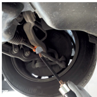
Déblocage des biellettes de direction