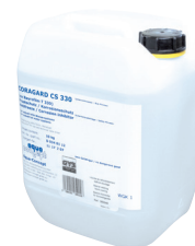
ref. 052246 Liquide de refroidissement CORAGARD CS 330 - 10 l