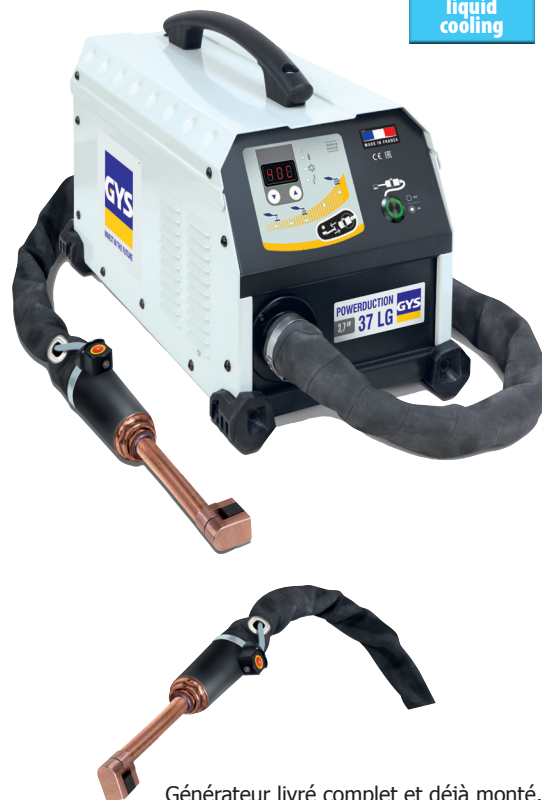
Générateur livré complet et déjà monté, avec 1 inducteur de chauffe 90°.